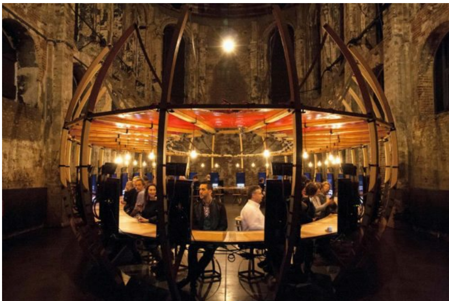
Berlin, Perhaps all the dragons

ANCONA- Inteatro Festival è nel pieno del suo corso. Iniziato il 19 giugno, tra Polverigi ed Ancona, registra la sua quarantunesima edizione. Lo storico Festival, nato tra le colline marchigiane, presenta un'edizione tra danza italiana e compagnie internazionali.