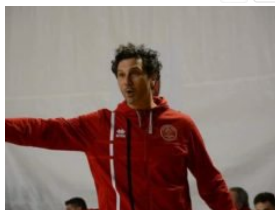
Volley, la Bontempi Ancona inizia a formarsi

Questo sito utilizza i cookies per offrirti una migliore esperienza di navigazione sul sito. Continuando a navigare accetti l'utilizzo dei cookies. Per maggiori informazioni clicca qui Chiudi