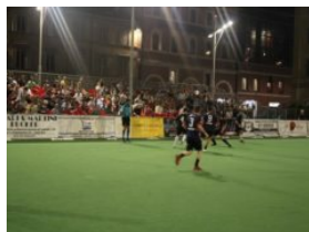
Futsal, al Città di Ancona si chiude la fase a gironi

Ti potrebbero interessare Di più sull'autore