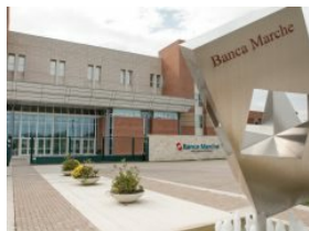
Banca Marche, arbitrato Anac: accolti 276 ricorsi degli obbligazionisti subordinati