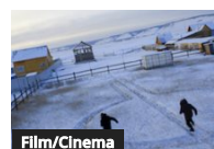
The Strange Sound of Happiness