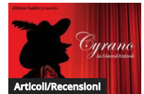
Articoli/Recensioni su Cyrano