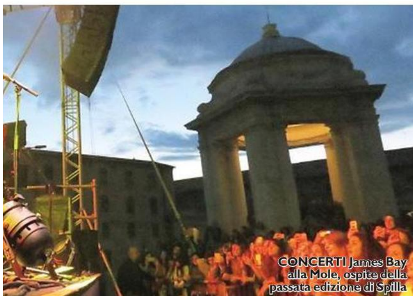
CONCERTI James Bay alla Mole, ospite della passata edizione di Spilla