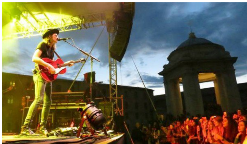
James Bay alla Mole, ospite della passata edizione di 'Spilla'

Ultimo aggiornamento: 10 giugno 2017 ore 14:47